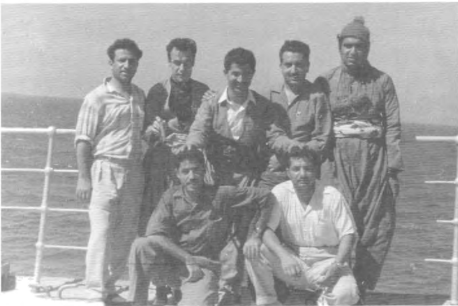
فېستىۋالى لاوان لە مۇسكۆ